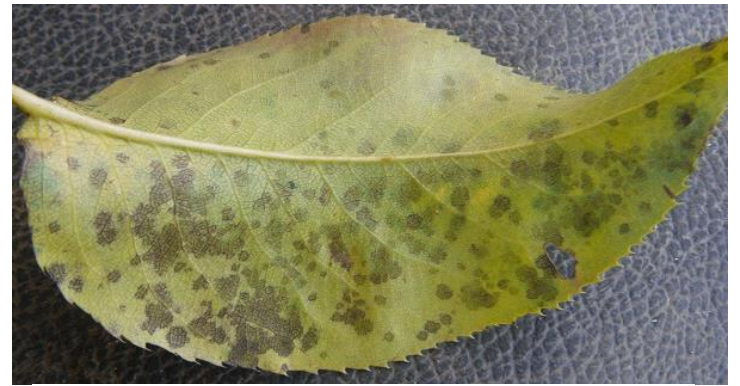
写真 黒星病秋型病斑(薄墨色の黒い斑点)

つきましては、 来年の黒星病の発生を防止するため、秋季防除や落葉処理の徹底をお願いします。