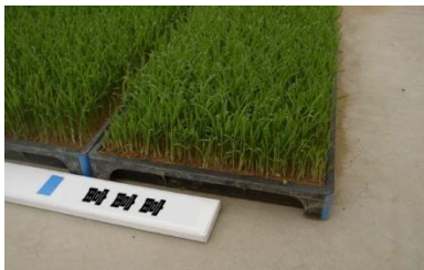
写真1：品種名の表示